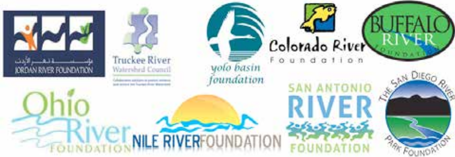
Şekil 3. Dünya Bazı Önemli Havza Sivil Toplum Kuruluşlarının Amblemleri

Dünyada birçok STK olduğu görülebilir Amerika'da daha gelişmiş bir örgüt yapısıyla Havza/ Nehir kuruluşları dikkat çekmektedir. Bunun yanında birçoğu vakıf şeklinde olduğu görülmektedir. Bunlara; Yolo Basin Foundation, Jordan River Foundation, Buffalo River Foundation, Nile River Foundation, Colorado River Foundation, San Antonio River Foundation, The San Diego River Foundation... gibi örnekler verilebilir.