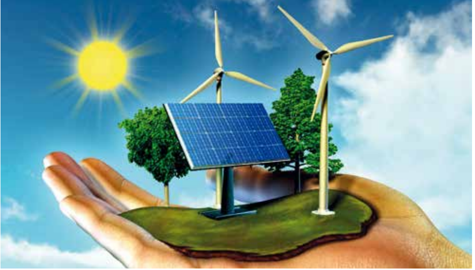
Şekil 2. Havzalarda Sürdürülebilir Arazi Yönetimi ve Rehabilitasyonu için Sivil Toplum Kuruluşları Geliştirilmelidir.

Türkiye’de STK’ların etkinlik düzeylerini yükseltebilecek birliktelikleri oluşturma becerisi yeterince gelişmediğini savunarak STK’ların doğa koruma alanında çoğunlukla yarışmacı ve kimi durumlarda da çatışmacı ilişkiler içerisinde olduğunu dile getirmiştir. 1980’li yıllarda Türkiye’de de egemenleşen ekonomik, toplumsal ve kültürel ilişkilerin biçimlendirdiği değer yargıları STK’ları katılcılaştırılmış ve taşeronlaştırılmıştır, denilmiştir.